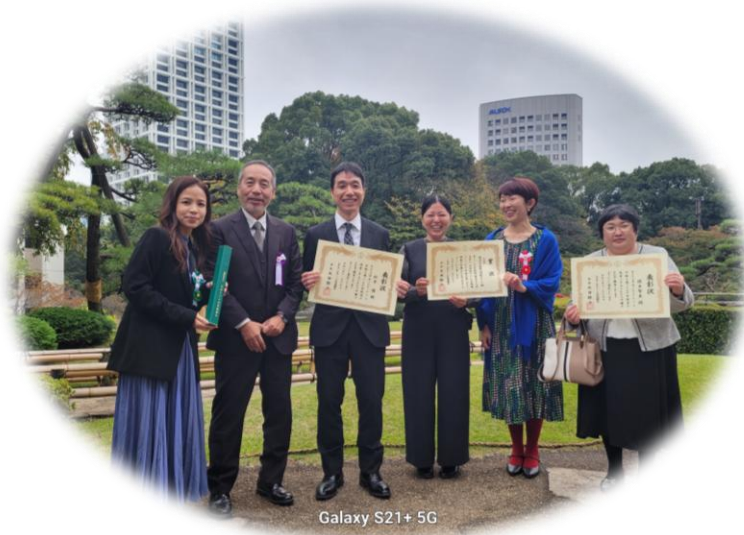
Galaxy S21+ 5G