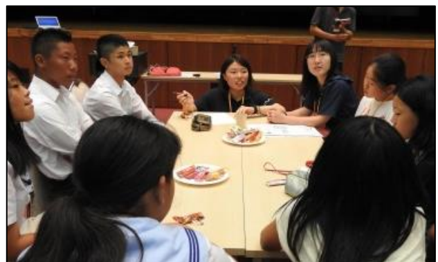
(動画を観た後、話し合っているところ)

今回撮影された動画は、10月20日予定の滋賀県スマホサミット in 近江八幡で活用される予定です。短時間で撮影できたのは、学生の皆さんのサポートがあったことは当然ですが、参加した児童・生徒の皆さんの意欲や各グループのチームワークがあったからだと思います。