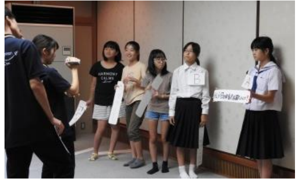
(動画を撮影しているところ)

次の活動は、動画をとる打ち合わせと準備です。今回は3グループに分かれていましたので、次の3つのテーマになりました。