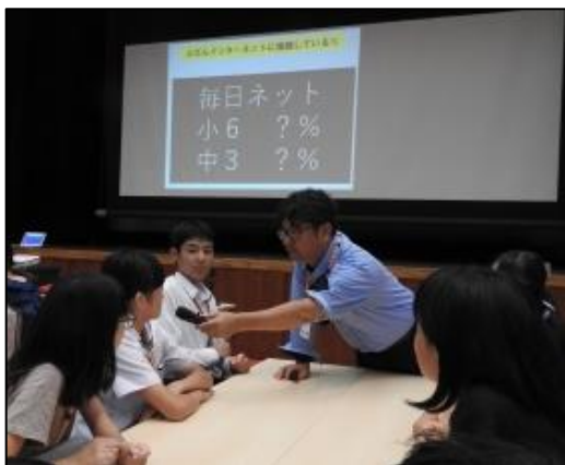
(アンケート結果について答えているところ)